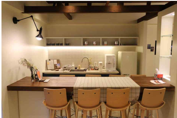
<모두의살롱 1호 효자>