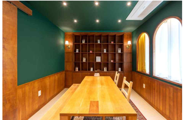
<전환가게 HUB 아트살롱>