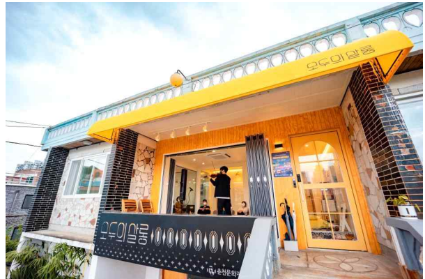
<모두의살롱 2호 후평>